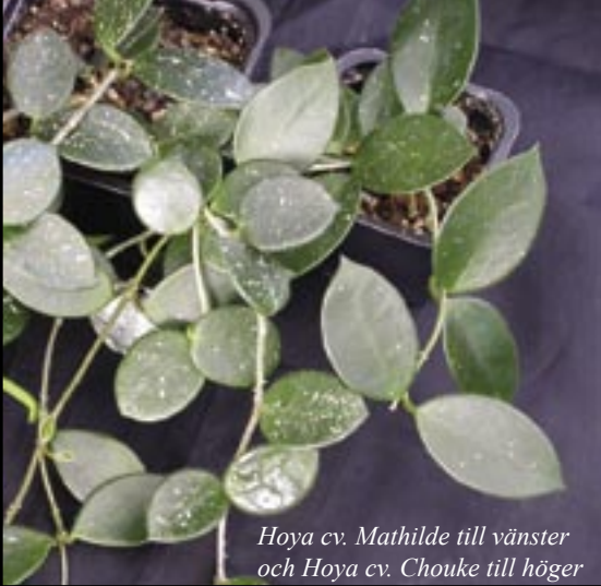
Hoya cv. Mathilde till vänster och Hoya cv. Chouke till höger