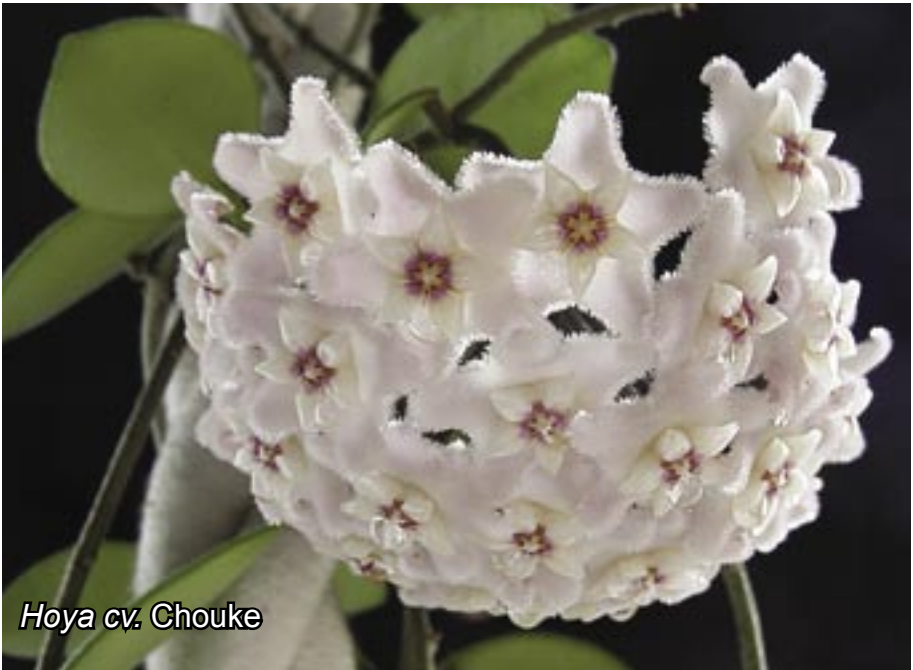
Hoya cv. Chouke