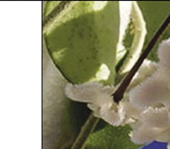
Hoya cv. Mathilde