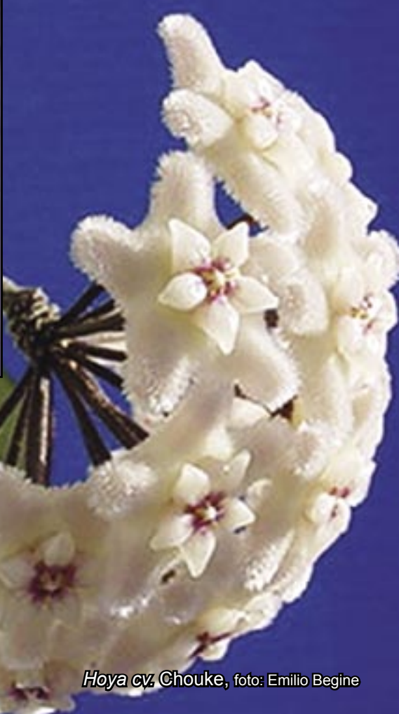
Hoya cv. Chouke